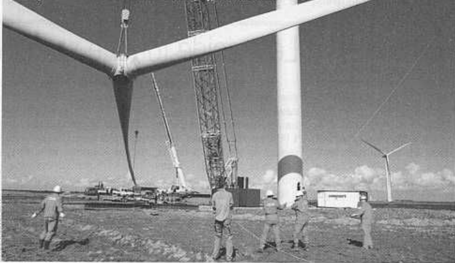
Montage d'une hélice d'éolienne à Bouin (85), en mars 2003

sée que de 253 MW en 2003 à 386 MW fin 2004. « Il faudrait 12 milliards d'euros d'investissements d'ici à 2010 pour combler le retard », assurent les industriels du secteur.